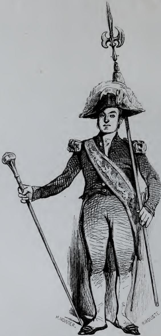
Le Suisse d'Église.